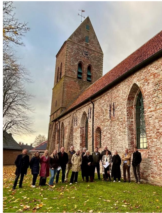
Het ACVG op bezoek in Godlinze, met rondleiding door vertegenwoordigers van OBG en gemeente Eemsdelta

Het ACVG stelt ook jaarlijks een werkprogramma op met de onderwerpen waarover het ACVG in het daaropvolgende jaar verwacht te adviseren. De inhoud ervan kan veranderen als de actualiteit daarom vraagt. De staatssecretaris heeft het ACVG-werkprogramma 2026 in het kader van Prinsjesdag aangeboden aan de Eerste en Tweede Kamer. Op dezelfde dag heeft het ACVG het ook op zijn website gepubliceerd.